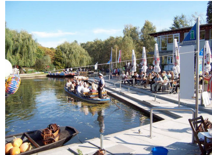
Eine Fahrt auf einem Kahn gehört im Spreewald einfach dazu.

Foto: 02.08.12, 17:03h, aktualisiert 02.08.12, 17:08h